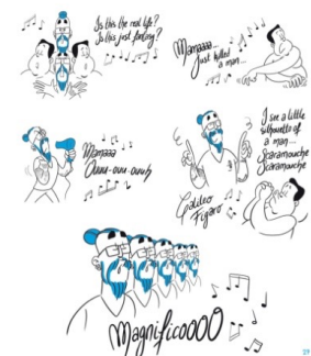
¡Viva la vida!: Del primer al último día, de l’Homme étoilé.