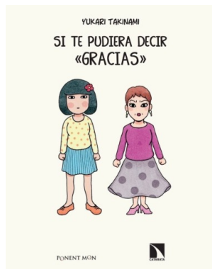
Si te pudiera decir “gracias”, de Yukari Takinami. ©Ponent Mon, 2020.

Aunque el cómic tiene momentos de humor, también contiene críticas hacia la asistencia sanitaria. La falta de empatía, las negligencias e incluso la mala praxis contrastan con los episodios domésticos, retratados con ternura.