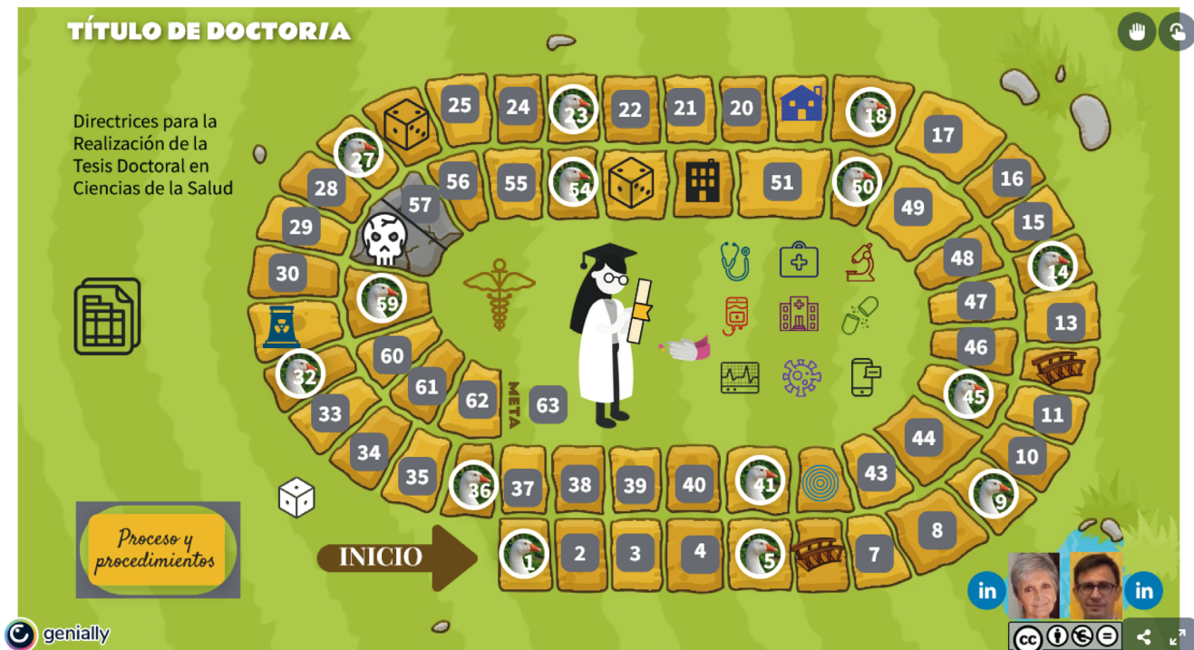
Figura 1. El juego de la oca.

"La tesis doctoral consistirá en un trabajo original de investigación elaborado por el candidato en cualquier campo del conocimiento, con el objetivo de capacitarle para desempeñar un trabajo autónomo en el ámbito de la I+D+i."