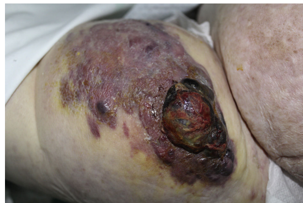
Figura 1 Tumoración de gran tamaño en cara lateral externa de muslo izquierdo.

El estudio histopatológico de la lesión reveló una proliferación dérmica de vasos anastomosados y tapizados por endotelio de aspecto pleomórfico con abundantes mitosis, con positividad frente a p53, CD31 y CD34 y negatividad para S100 y citoqueratinas; con lo que se confirmó el diagnóstico de angiosarcoma. Se realizó una tomografía computarizada (TC) que descartó afectación a distancia. Tras ser evaluada por un comité multidisciplinar de nuestro hospital se desestimó tratamiento quirúrgico a causa de la extensión de la lesión, rechazando la paciente el uso de quimioterapia y radioterapia de forma paliativa.